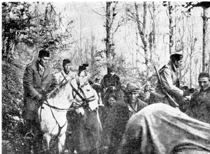
Stab 2. proleterske divizije na maršu prema Drini posle bitke na Neretvi

retve i Rame. Posebna greška je bila što nismo na vreme ocenili jačinu neprijatelja u Konjicu i odredili respektivne snage za napad na ovo uporište dok se još nije pripremilo za odbranu. Naše nedovoljne snage koje smo upućivali pojedinačno, neprijatelj je uspešno odbijao, a kad su mu prispela pojačanja od Sarajeva, više nismo ni mogli zauzeti Konjic.