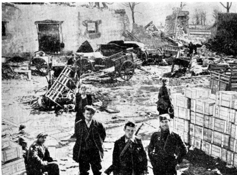
Ruševine stare austrijske tvrđave u Jablanici, iz koje su se branili Italijani — deo zaplenjenog materijala i opreme

raca 4. crnogorske brigade, a komandant Jablanice je za zlostavljanje nevinog i golorukog naroda iskusio zasluženu kaznu.