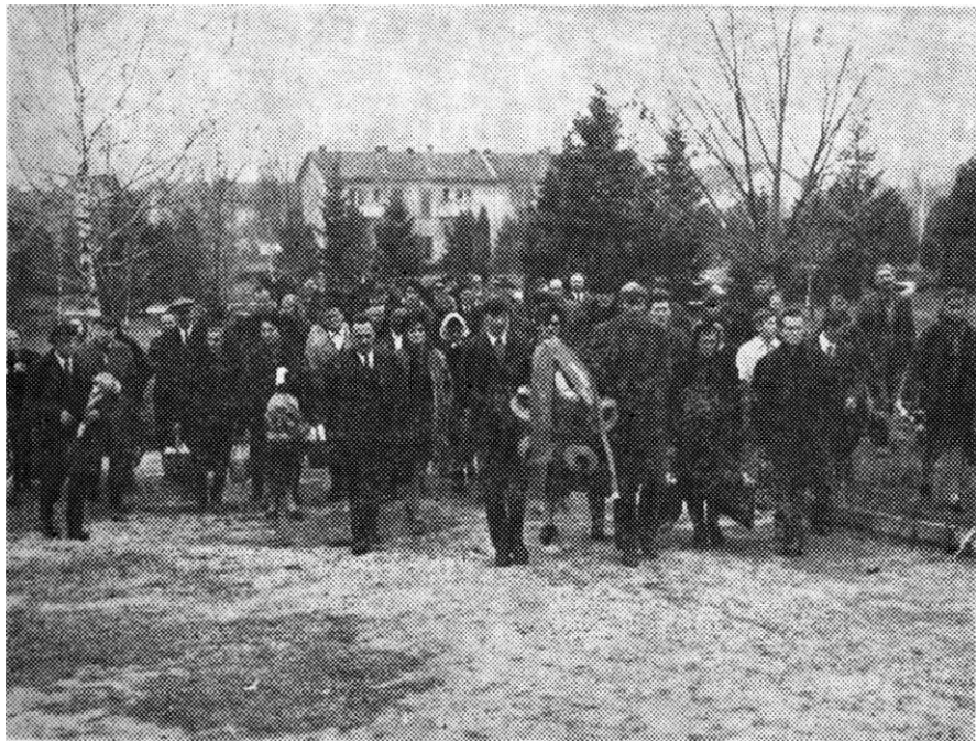
Са једне номеморације на спомен-номплесу на Крушику

Новосаграђено партизанско спомен-гробље урађено је у облику неправилног троугла. Захвата површину од два и по хектара. Око њега подигнута је жива ограда. Главни улаз налази се на завршетку Улице палих бораца. На самом улазу уређен је простор