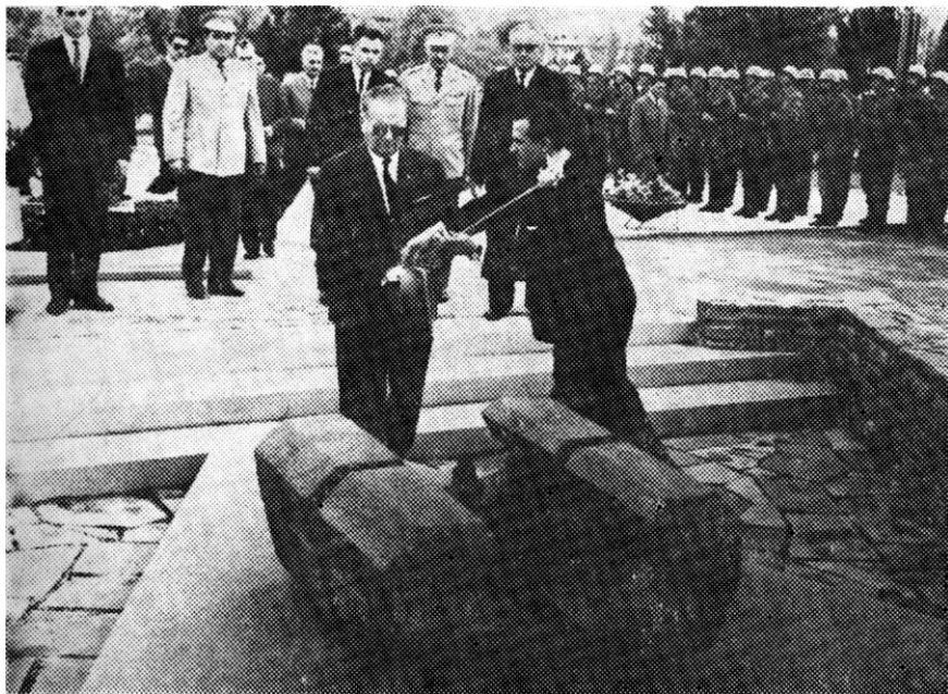
Председник Тито на Крушину