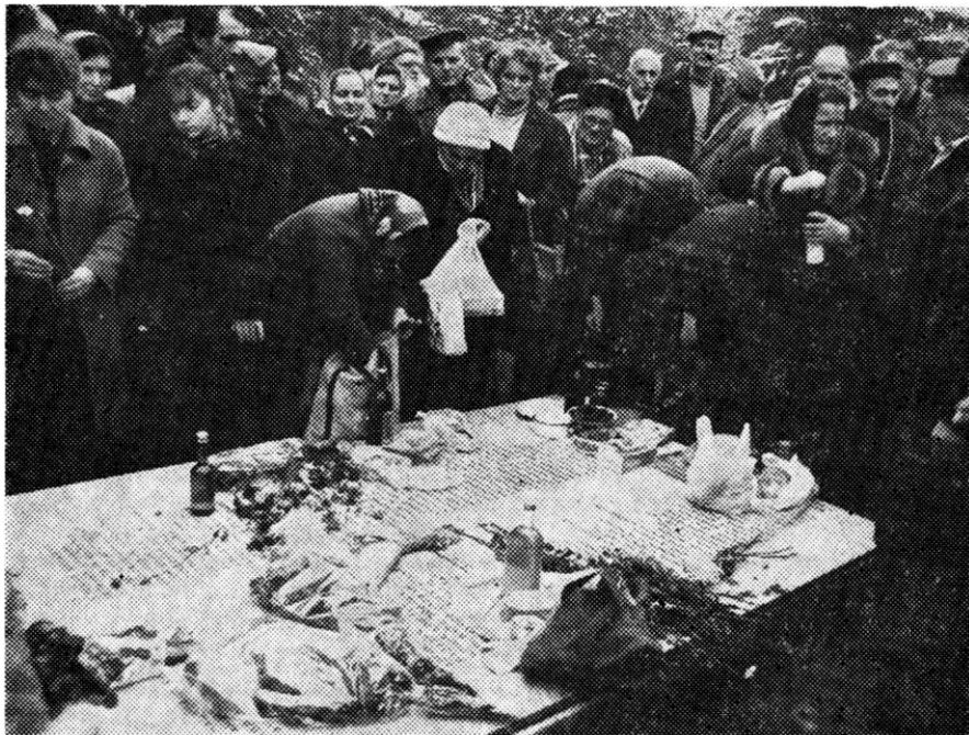
Родбина стрељаних сване године се онупља на Крушику

Поред традиционалних комеморативних свечаности посвећених масовном стрељању, у Партизанском опомен-гробљу на Крушику одржавају се и многе друге акције и манифестације, које преvasходно имају за циљ неговање борбених и револуционарних традиција. Између осталих, овде се сваке године одржавају комеморативне свечаности — 4. маја, посвећене годишњицама смрти Јосипа Броза Тита, председника Социјалистичке Федеративне Републике Југославије, председника Савеза комуниста Југославије, врховног команданта наших оружаних снага. Овде повремено при-