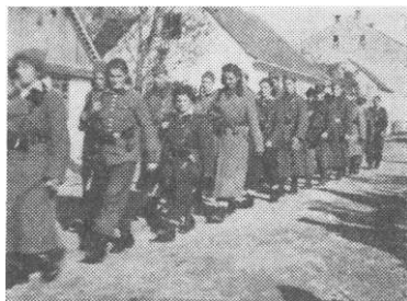
Proljeće 1944. Treći bataljon na maršu

Štab 17. udarne brigade je 18. 2. 1944. naredio novi marš pravcem sela Belice — Zgrade — Bučje — Drenovac — Komorice do s. Pavlovci. Sutradan je pokret nastavljen pravcem sela Vrhovci — Daranovac — Zakorenje do sela Koprivna, Čečavac i Snjegović. 348 Međutim, štab 28.