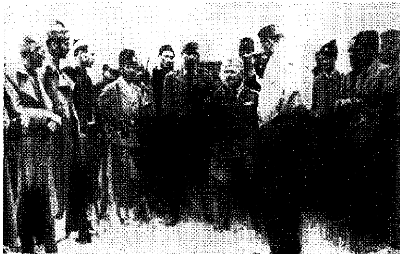
četnicima iz okoline Knina talijanski oficir daje instrukcije za borbu protiv partizana

Iako na tom sastanku nije postigao suglasnost svih četničkih rukovodilaca u pitanju borbe protiv partizana, Đujić je sam, s četnicima pod svojim direktnim utjecajem, počeo ubijati parti-