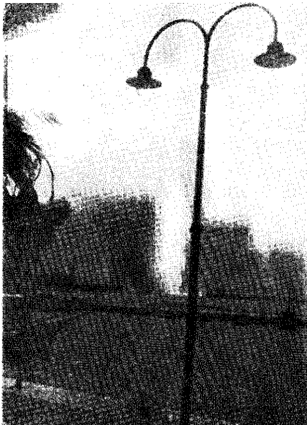
Split, 6. aprila 1941. Talijanski avioni bombardiraju grad

žen talijanskim trupama na zadarskom frontu. On najbolje govori, kakav je mogao biti ishod operacija na tom dijelu, da je bilo riješivosti štaba divizije i oficira da se brani zemlja.