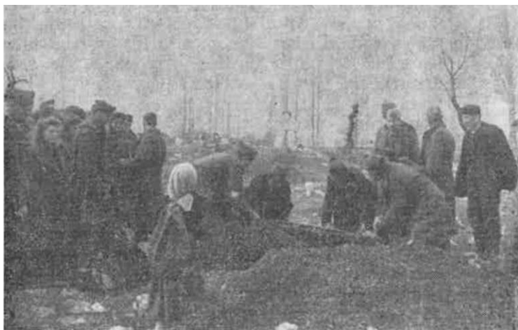
Sahrana poginulog borca G. brigade u s. Bilišani — oktobra 1944. godine

koje su bile određene za napad na neprijatelja na liniji Drniš—Knin;