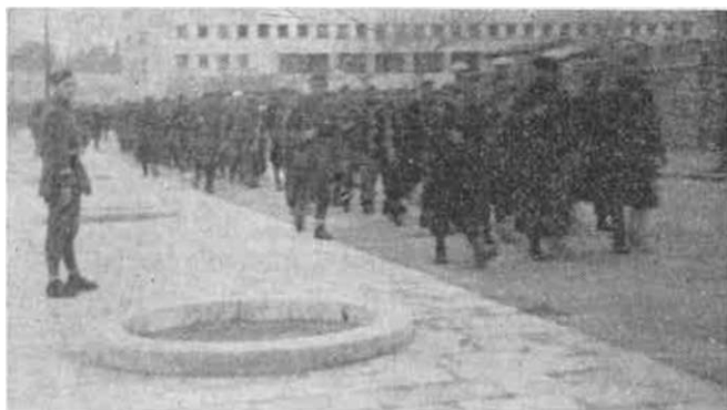
U kombinovanom pokretu za Mostar; 6. brigada se ukrcava u brodove u Splitu — februara 1945. godine.

— 1. bataljon je od Zadra do Šibenika prebačen kamionima, železnicom od Šibenika do Splita, odakle je prevezen brodovima za Makarsku;